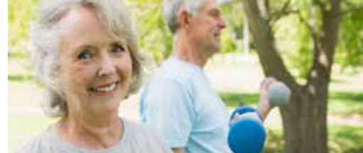
Resultaten Retie (be)weegt ogen mooi! p.3