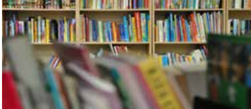
Nieuwtjes uit de bibliotheek p.2